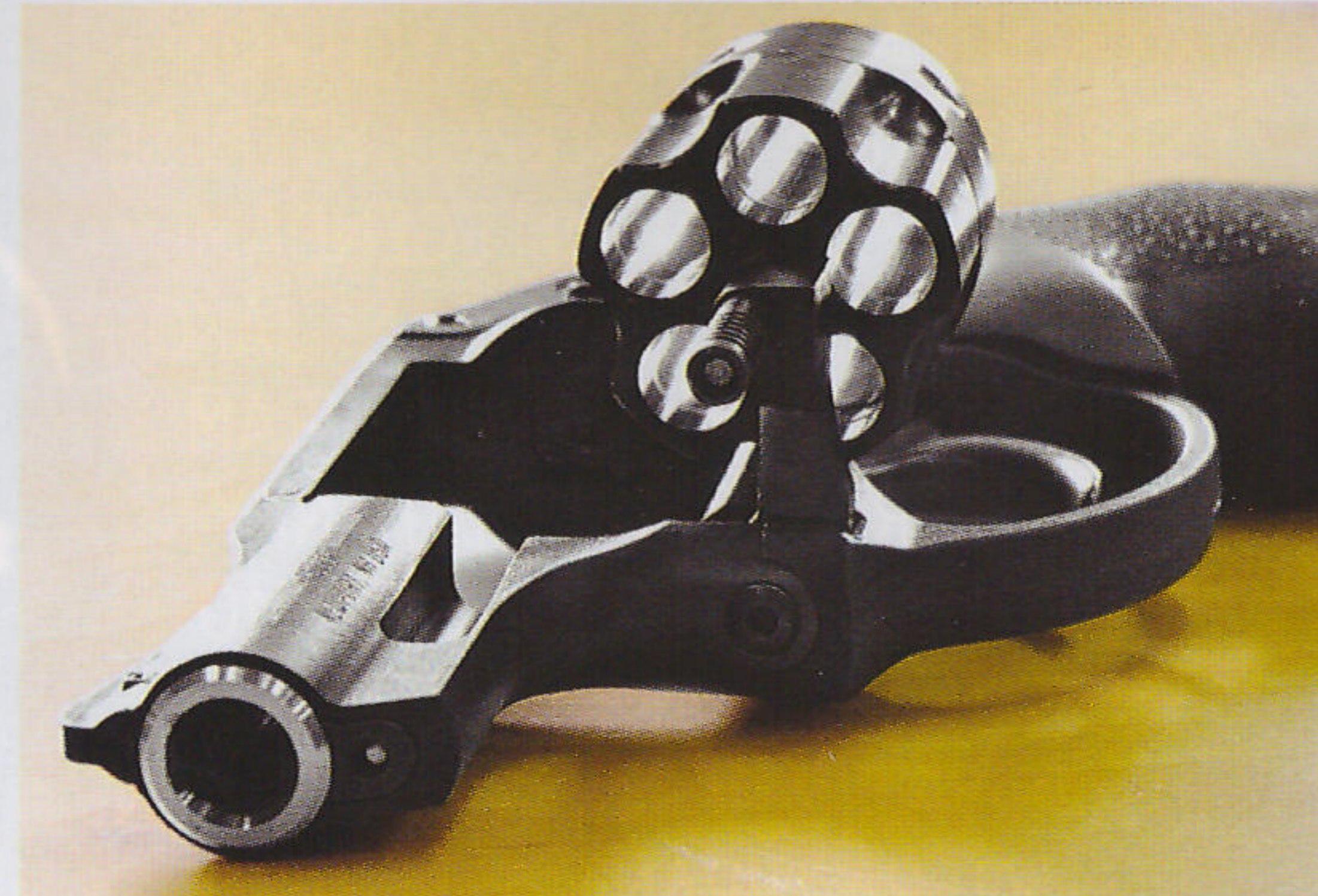
Ruger LCR byl prvním sériově vyráběným revolverem s částečně plastovým rámem

Rugerova výroba revolverů začala, dá se říci, od roku 1953 představením malorážkového revolveru Single-Six odvozeného z modelu Colt Pacemaker. Začínajícímu průmyslníkovi neušla poptávka po podobných zbraních a reagoval na ni v duchu své jednoduché filozofie: co nejjednodušší výroba a co nejvyšší zisk. Model Single-Six se stal základním v kompletní řadě Rugerových jednočinných revolverů a vyráběl