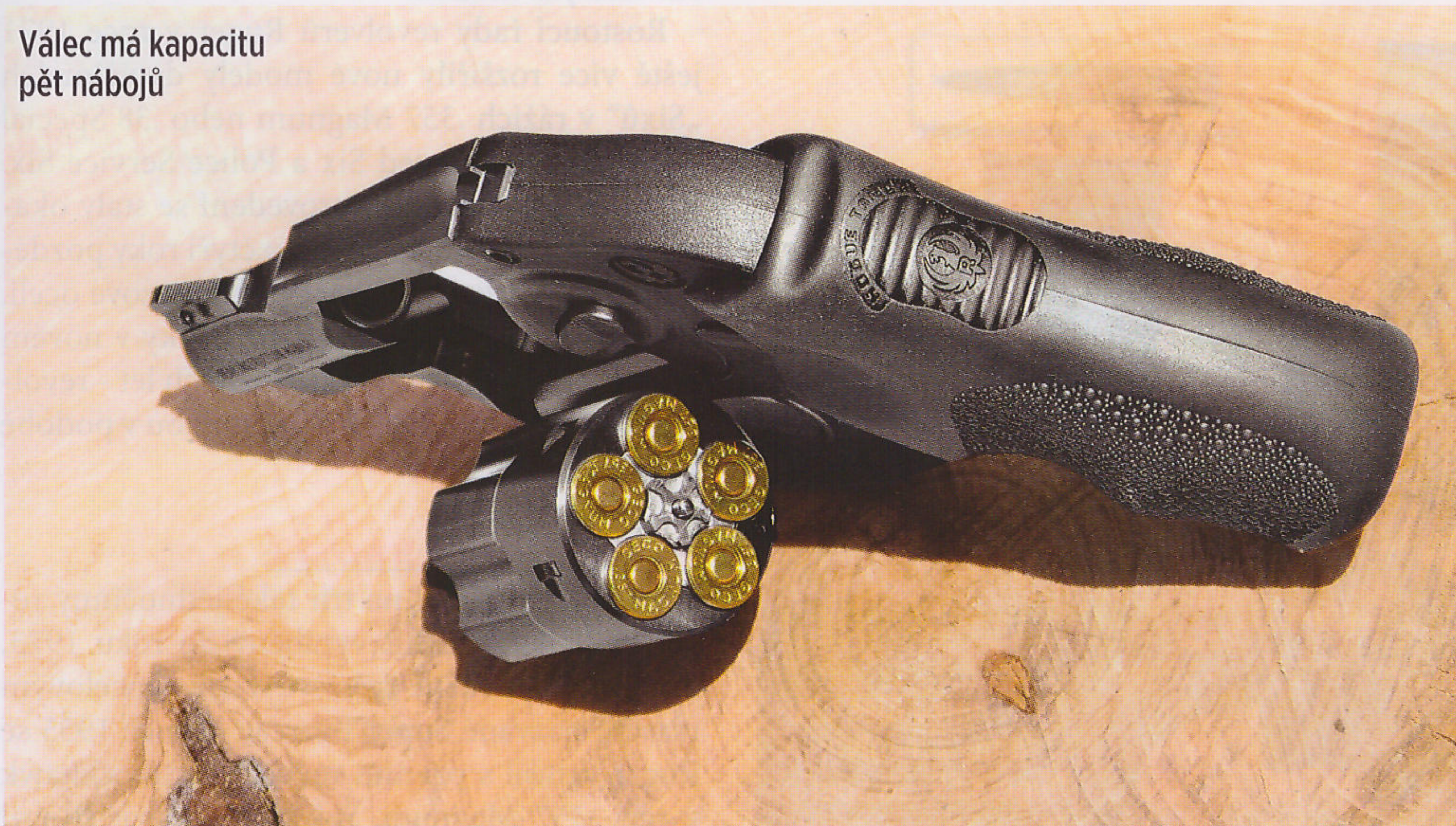
Válec má kapacitu pět nábojů

Model Aljaška vychází z řady revolverů Ruger Super Redhawk Double Action magnumových revolverů firmy Sturm, Ruger & Company, s níž výrobce začal v roce 1987, kdy byly zařazeny do výrobního programu výkonnější náboje. Představen byl s hlavními dlouhými 7,5 a 9,5 palce v ráži .44 Magnum. Spoušťový mechanismus i rukojeť má zbraň stejné jako revolver Ruger GP-100 .357 Magnum, avšak rám je o dost více zesílen. Typ Alaskan je vybaven přilnavou pryžovou pažbičkou Hogue →