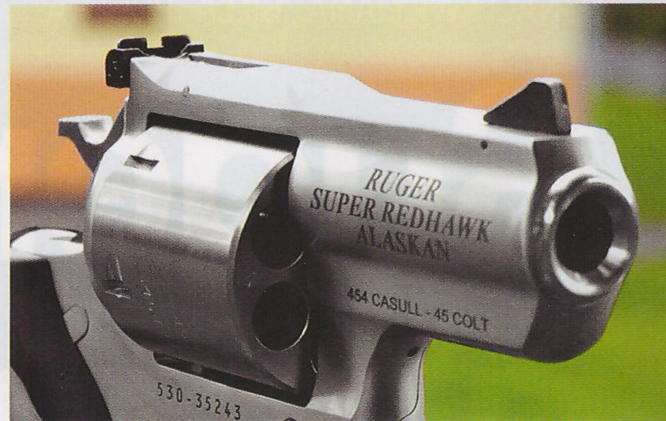
Revolver Ruger Super Redhawk Alaskan v ráži .454 Casull s hlavní 2,5 palce je respekt vzbuzující cvalík