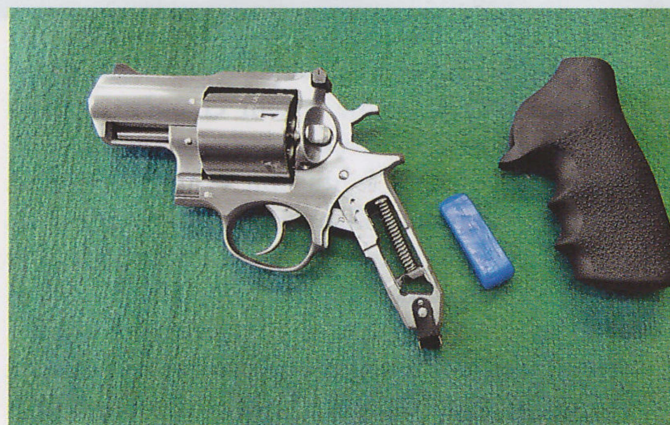
Pro lepší absorpci energie zpětného rázu je dovnitř rukojeti vkládán výrobcem ještě i speciální silikonový bloček

se až do roku 1973. Roku 1956 následovala varianta s rámem z lehké slitiny, o tři roky později verze v ráži .22WMR a pět let nato se výrobní program rozšířil o model Super Single-Six se stavitelným hledím.