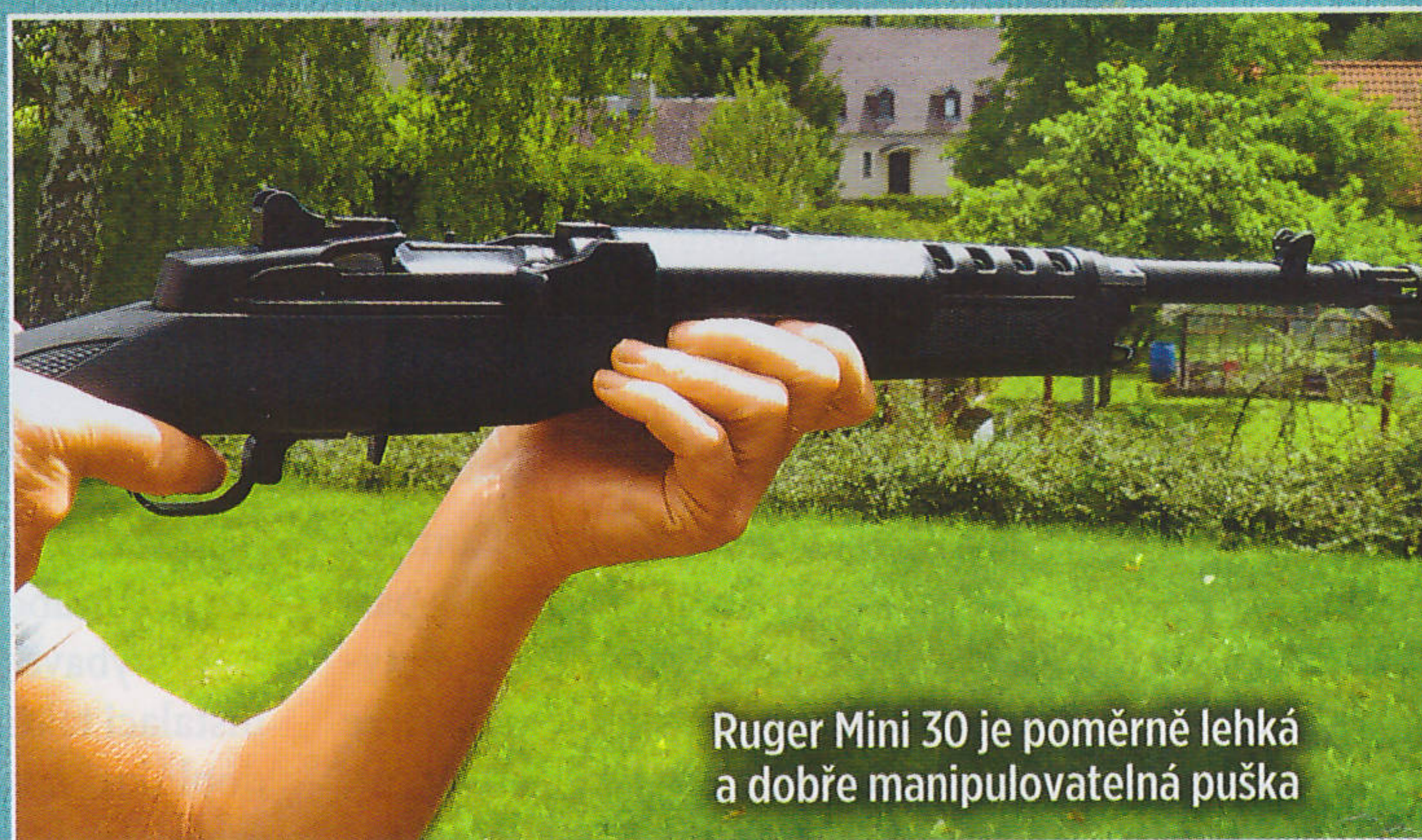
Ruger Mini 30 je poměrně lehká a dobře manipulovatelná puška