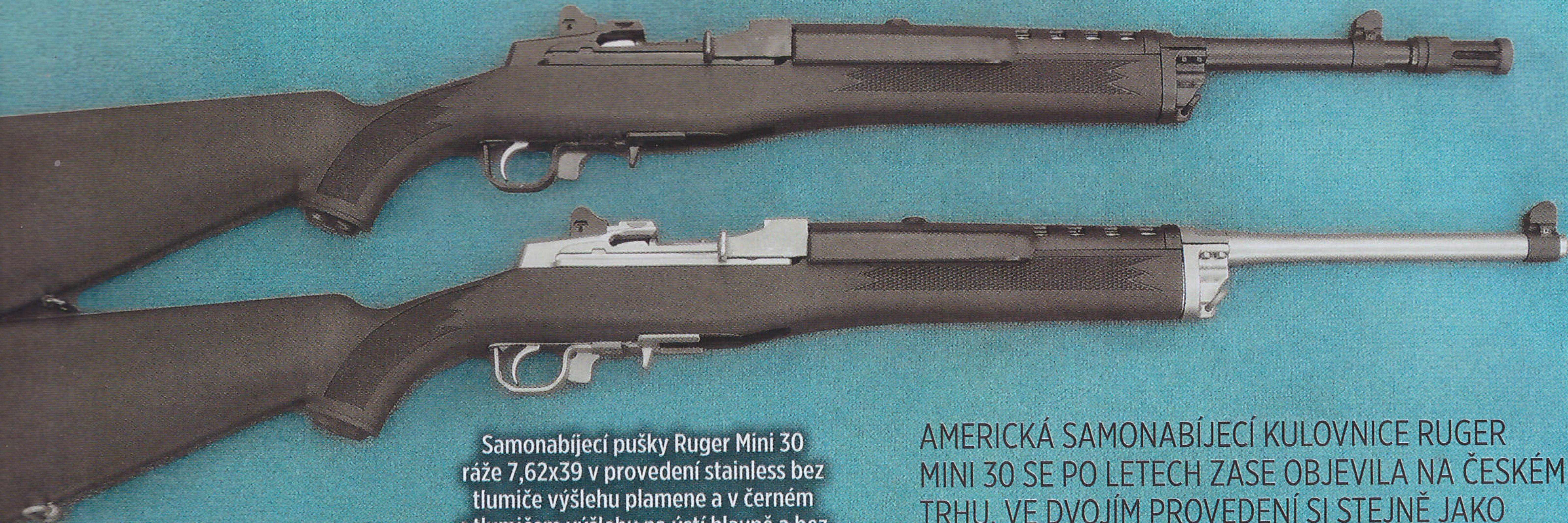
Samonabíjecí pušky Ruger Mini 30 ráže 7,62x39 v provedení stainless bez tlumiče výšlehu plamene a v černém s tlumičem výšlehu na ústí hlavně a bez zasunutých zásobníků

AMERICKÁ SAMONABÍJECÍ KULOVNICE RUGER MINI 30 SE PO LETECH ZASE OBJEVILA NA ČESKÉM TRHU. VE DVOJÍM PROVEDENÍ SI STEJNĚ JAKO DŘÍVE ZŘEJMĚ ZÍSKÁ SVÉ DALŠÍ PŘÍZNIVCE A OBDIVOVATELE, KTERÍ SI POTRPI NA SAMONABÍJECÍ ZBRANĚ S ŠIRŠÍM VYUŽITÍM A S LEGENDÁRNÍMI AMERICKÝMI PŘEDKY V RODOKMĚNU.