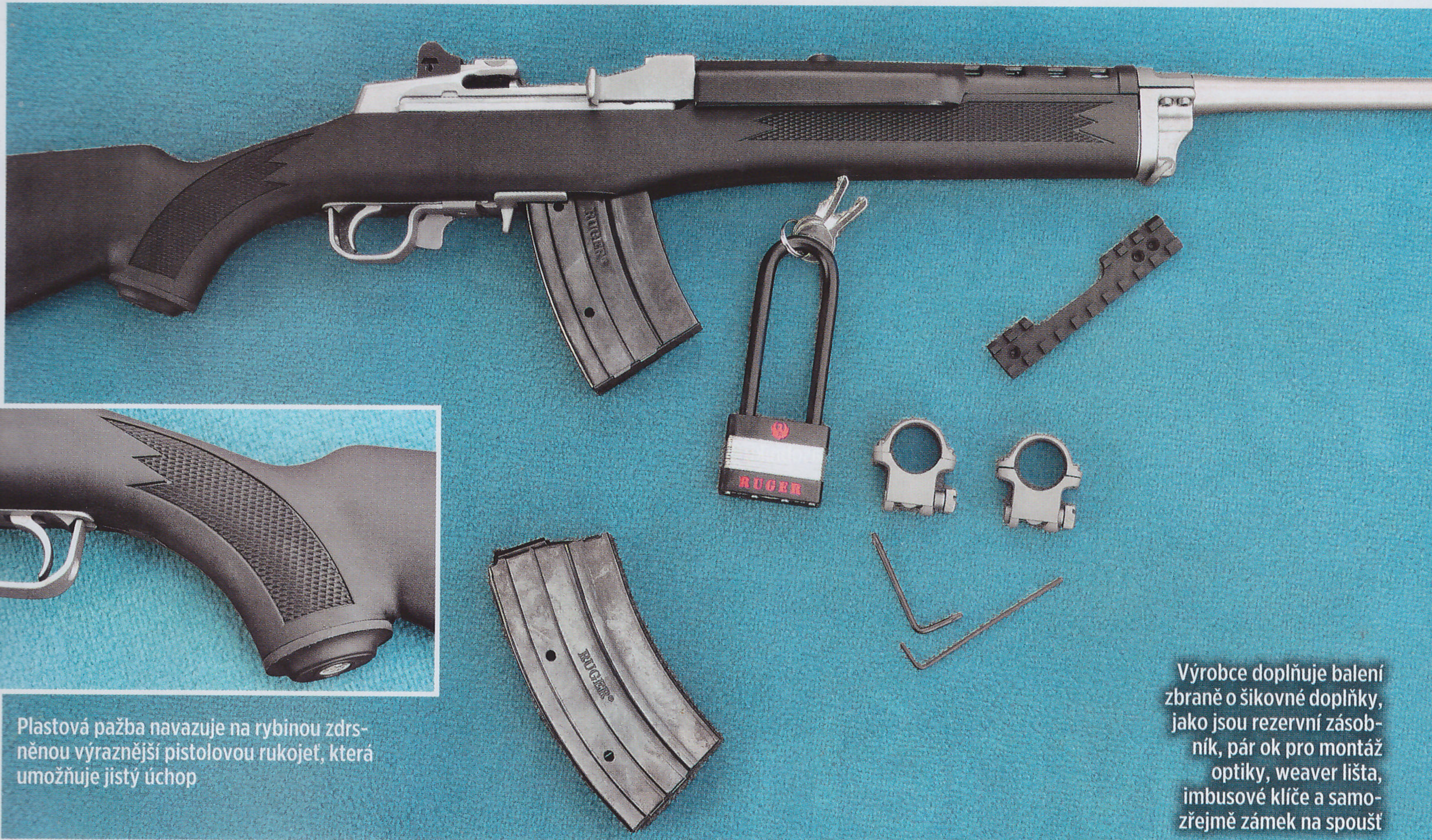
Plastová pažba navazuje na rybinou zdrsněnou výraznější pistolovou rukojeť, která umožňuje jistý úchop